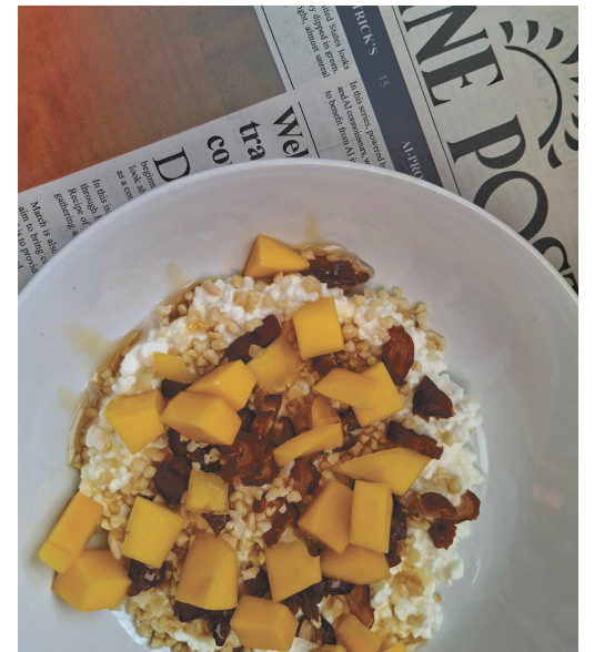
Für extra Frische: Etwas Saft- und Abrieb eine Bio-Limette zum beträufeln, perfekt für einen tropischen Geschmack.